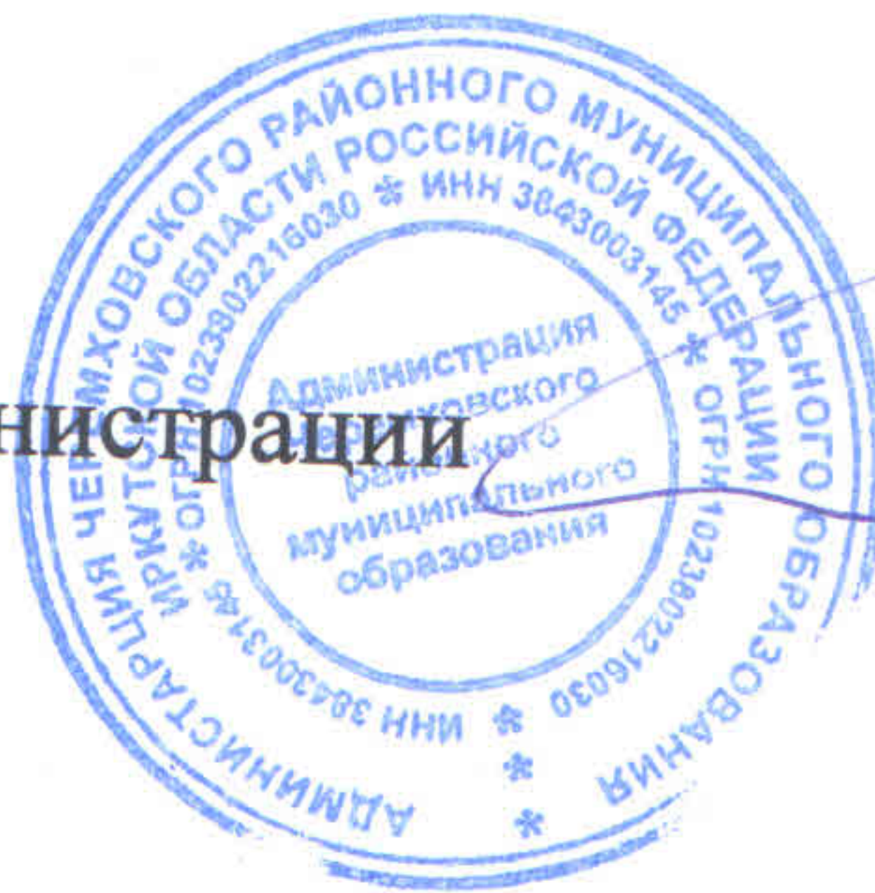
М. Г. Рихальская