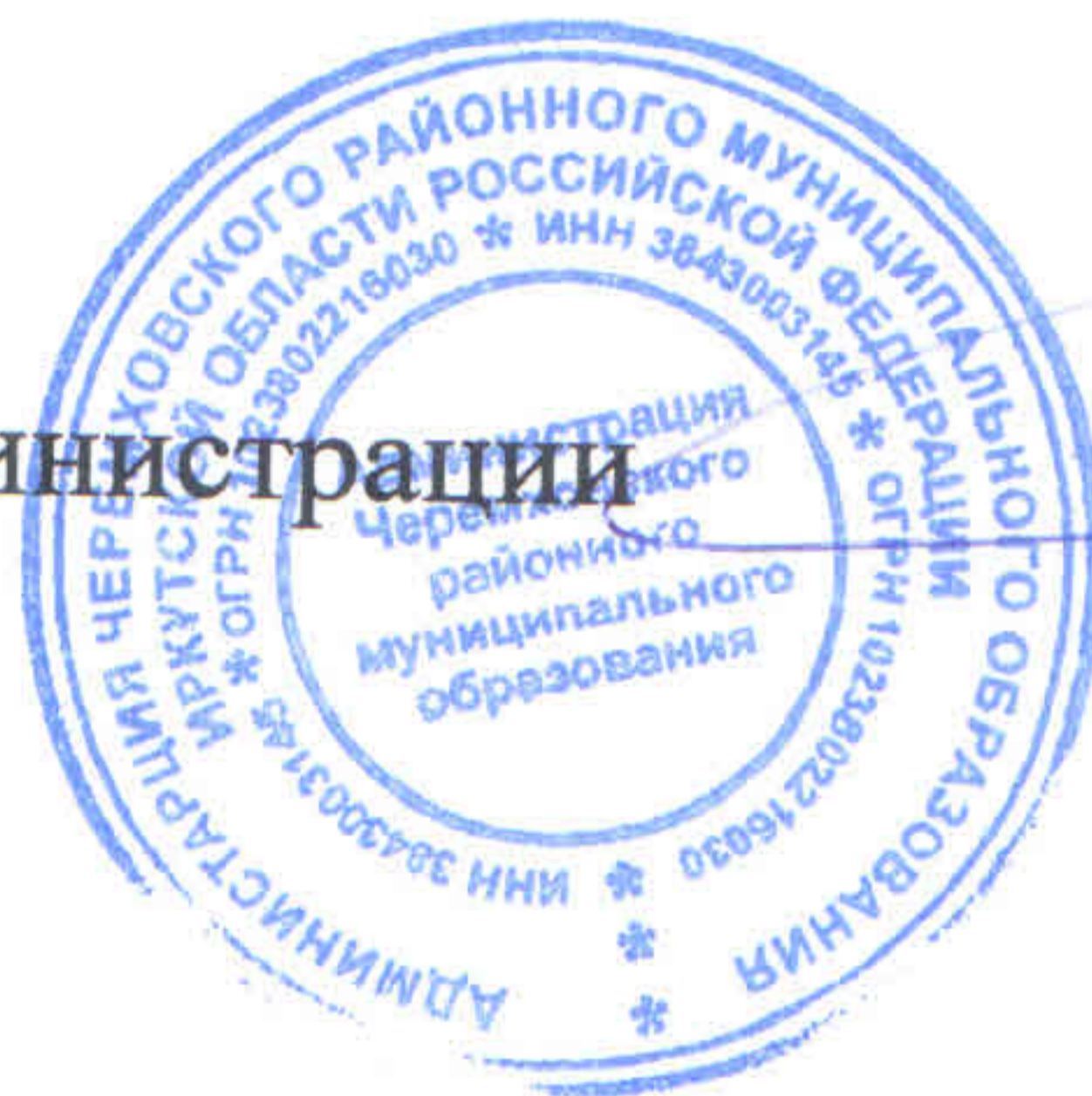
М. Г. Рихальская